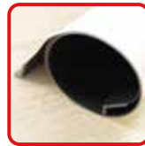
丸めてコンパクト収納