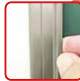
簡単に貼ってはがして ワンタッチイージーバー