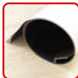
丸めてコンパクト収納