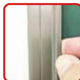
簡単に貼ってはがして ワンタッチイージーバー